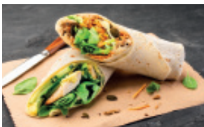
BOX WRAPS 39,00 € HT - 42,90 € TTC 14 PCS. 5/6 PERS.

Carottes râpées, roquette, graines de grenade et gomasio • Mélange de maïs grillé au poivron rouge et haricots rouges, fèves de soja et tomates, guacamole et roquette • Tomates cerises et mozzarella au pesto et roquette.