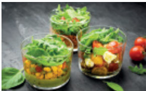
BOX MINI SALADES 26,00 € HT - 28,60 € TTC 9 PCS. 3/4 PERS.

Salade de légumes grillés, roquette, huile d'olive au basilic et coulis au balsamique de Modène • Pain pita, tartinade de thon au pesto, tomate, batavia et oignon rouge • Mini pain aux céréales, carpaccio de bœuf mariné, pesto et parmesan.