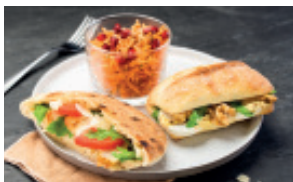
BOX MIXTE 39,00 € HT - 42,90 € TTC 12 PCS. 4/5 PERS.

Pain pita, tartinade de thon au pesto, tomate, salade et oignon rouge • Pain pita, filet de poulet en salaison, tomate, parmesan, sauce caesar et roquette.