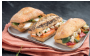
BOX MINI SANDWICHS 39,00 € HT - 42,90 € TTC 12 PCS. 4/5 PERS.

Tartinade de thon, œuf, batavia, tomate, pesto et basilic frais • Carottes râpées, tomate, houmous, batavia et graines grillées.