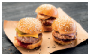
FIFTEEN BURGERS 32,00 € HT - 35,20 € TTC 15 PCS. 6/8 PERS.

Mini pain, fromage de chèvre, sauce miel moutarde, noix et roquette • Mini pain, mélange de légumes grillés et féta AOP • Mini pain aux céréales, saumon fumé et fromage fouetté aux herbes.