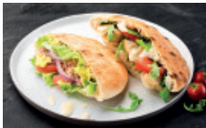
BOX DEMI-PITA 19,00 € HT - 20,90 € TTC 8 PCS. 4/5 PERS.